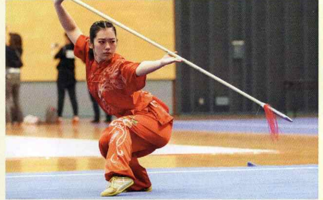
美しい太極拳の演武やカンフー映画さながらの武器を用いた演武も迫力満点 ※写真は第31回大会(大阪府開催)のものです