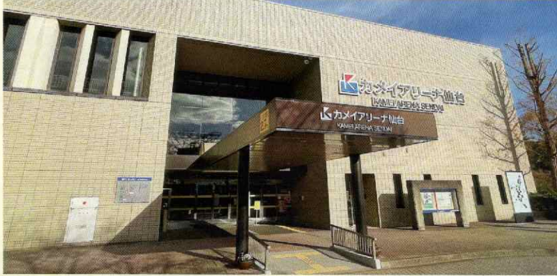
全国で選抜されたジュニア選手が頂点を競う！本大会は初の東北開催！国際大会メダリストの演武にも注目！

この大会は、国際大会へ出場する登竜門としても位置付けて実施され、毎年多くのジュニア選手が海外でもメダルを獲得しています。2024年の日本代表選手選抜については、国際武術連盟からの大会詳細の発表後に決定となります。